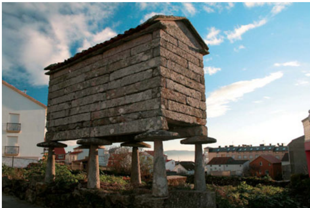
Hórreo en el cruce de Calle Hospital y Camino de la Insua.