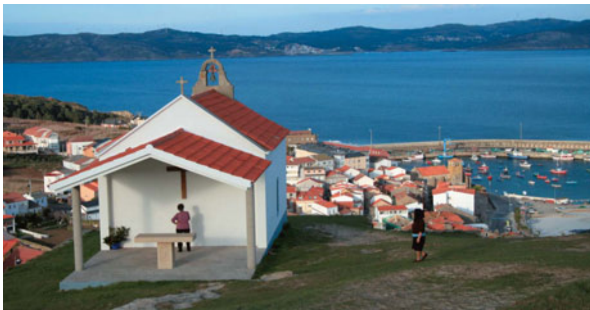
La Capilla de Santa Rosa domina la vista de Laxe.

Santa Rosa y los marineros de Laxe, suben en peregrinación a la ermita, a pedirle a la Santa, suerte y salud en su trabajo en el mar.