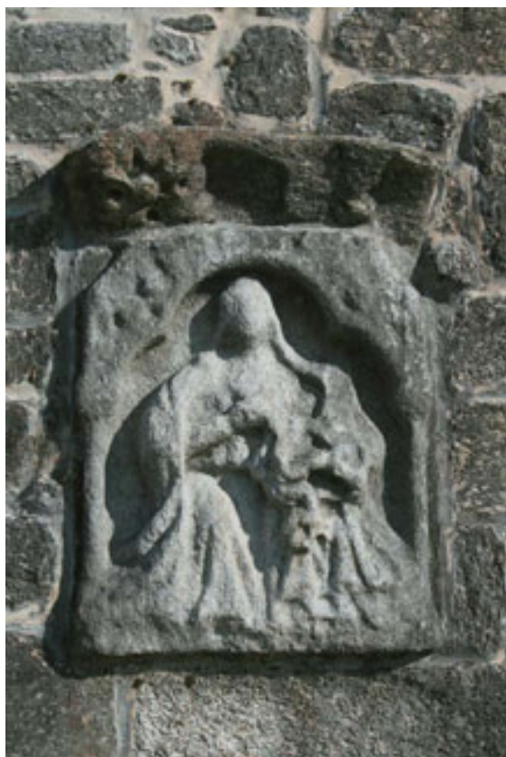
Detalle de la fachada de Santa María de la Atalaya.

donde debemos seguir a la izquierda por la Rúa do Campo entre las últimas casas, y girar nuevamente a izquierda entre muros de piedra, para bajar a la Fuente de Arriba. Siguiendo a derecha la señalización del PR-G 114, se alcanza finalmente el monte Cornaceiras (km 1,1/alt. 75 m), donde se encuentra la Capilla de Santa Rosa de Lima.