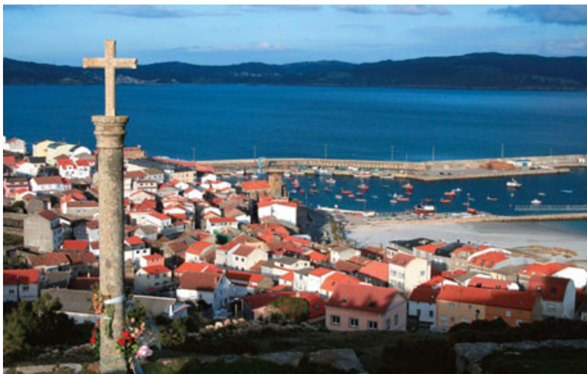
Cruz del Navegante y Laxe.

y a derecha por la Rúa Dos Plazuelas, para pasar por la Plaza del Cantón o del Mercado y acceder finalmente al Paseo Marítimo, donde termina esta primera ruta que os proponemos.