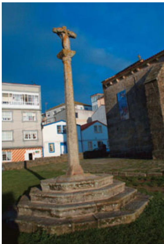
Cruceiro de Santa María de la Atalaya.

construida por la familia Moscoso, que fue ampliada con otra nave rectangular y posteriormente la torre. Construida con la orientación de los templos romanos, la puerta de entrada está rematada por un rosetón que ilumina el interior de la iglesia.