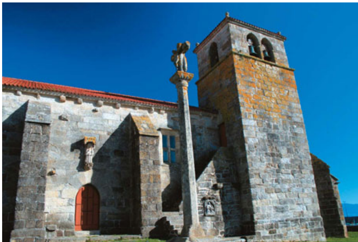
Iglesia de Santa María de la Atalaya.

to, pero también nos enseña la tranquila vida cotidiana de sus calles junto a la huerta tradicional y las magníficas vistas panorámicas desde la Capela de Santa Rosa, donde disfrutaremos del paisaje más encantador de Laxe.